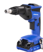
Wkrętarka 18 V do suchej zabudowy R-PDS18

Lekka i poręczna zakrętarka do montażu płyt gipsowo-kartonowych